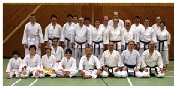
Teilnehmer des Lehrgangs