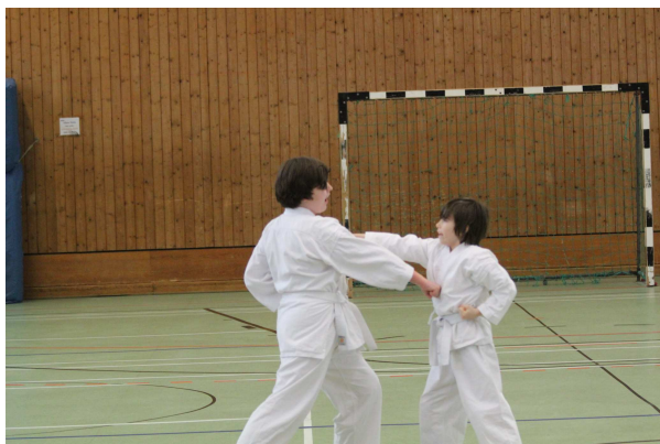
Max und Maxi in Aktion